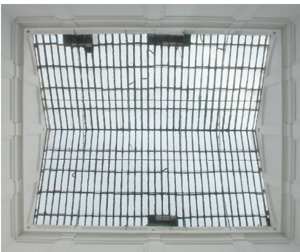
pohled na zastřešení zespodu